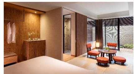
温泉露天風呂付プレミアムルーム イメージ

※上記はサービス料・消費税込の料金です。別途、入湯税を申し受けます。 ※料金はご宿泊日により異なります。詳しくはお問合せください。 ※提供のメニュー内容は変更となる可能性がございます。 ※ご夕食付きのプランもご用意しております。詳しくはお問合せください。