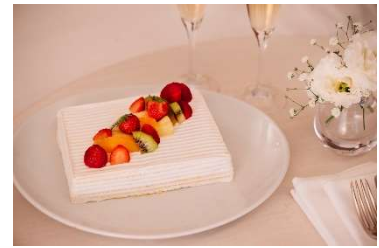
いちごのショートケーキ イメージ

フローリストによる装飾を施した一室限定のセレブレーションルームに、シェフ特製のいちごのショートケーキをお届けする宿泊プラン。オプションで信州のスパークリングワインや特別カクテル、冬季限定のスパトリートメントなどお選びいただけます。