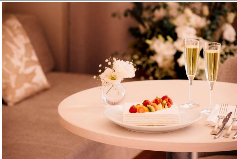
Winter Celebration Stay イメージ

大切な人と軽井沢で過ごす、心弾む冬のひととき 期間：2023年12月1日(金)～2024年2月29日(木)