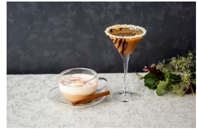
シーズナルカクテル イメージ

ホリデーシーズンにふさわしい、モーツァルトチョコレートリキュールをベースに目にも華やかに仕上げた2種のオリジナルカクテル。ラムを効かせたホットカクテルに ホットバタード 苺ソースやバターの風味が漂う「Hot Buttered ショコラ chocolat」と、ブランデーを合わせて甘さを抑え、アーモンドパウダーの食感と香ばしさがアクセントの「 チョコレートアレキサンダー Chocolate Alexander」。華やかな一杯とともに酔いしれる贅沢なひとときを。