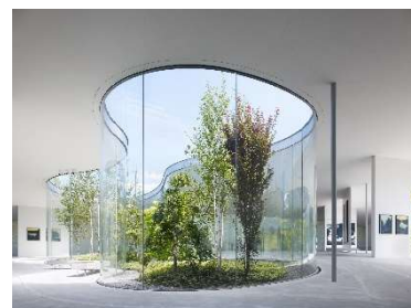
軽井沢千住博美術館

世界で活躍する日本画家・千住博氏の作品を美しい樹々や花とともに楽しめる美術館。地形の起伏形状を活かしてデザインされた建物は、建築家・西沢立衛が設計。周囲150種以上の植物に包まれ、大きな窓からは陽光が降り注ぎ自然とアートが融合した空間に。現在、新作「浅間山」と浅間山周辺の自然を彷彿とさせる作品の数々を展示中。森の中を散歩するような感覚で、千住博氏が表現する軽井沢の自然をお楽しみください。