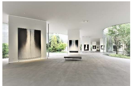
軽井沢千住博美術館

※上記料金はサービス料・消費税込みの料金です。別途、入湯税を申し受けます。 ※料金はお部屋タイプ・ご利用日により異なります。詳しくはお問い合わせください。