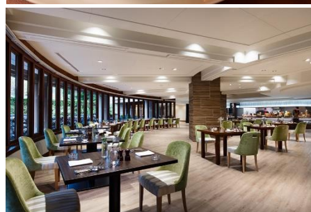
（写真上）ポワソンイメージ （写真下）Grill & Dining G