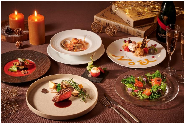
クリスマスディナーイメージ